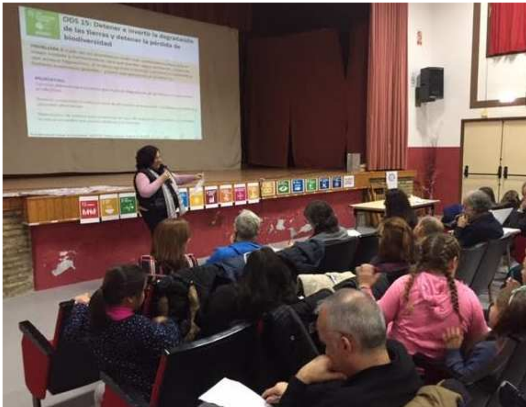
Ilustración 19. La exposición preliminar de los resultados y contenidos de este reporte fue realizada por los participantes locales del Rural Lab