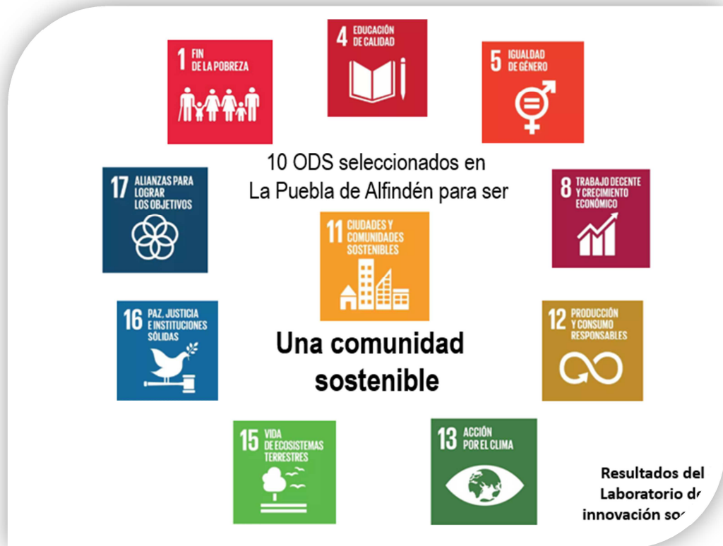
Ilustración 23. ODS seleccionados por representar retos a nivel local en La puebla de Alfindén