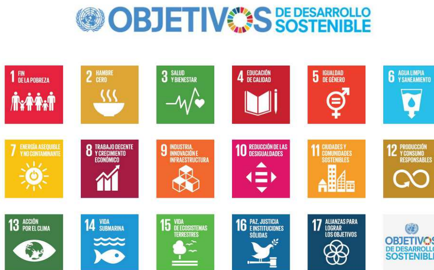
Ilustración 2. Los Objetivos de Desarrollo Sostenible 4

A pesar de que los ODS no son jurídicamente obligatorios, los gobiernos los han adoptado como propios y tienen la responsabilidad del seguimiento. Es una oportunidad para que desde diferentes escalas (local, regional, estatal) se reflexione y se propongan acciones específicas para desarrollar esta agenda que sea pertinente con la realidad de las comunidades y sus habitantes.