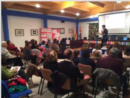
Rural Lab en La Puebla de Alfindén

atentamente Equipo de coordinación Rural Labs UNIZAR – INTERHES