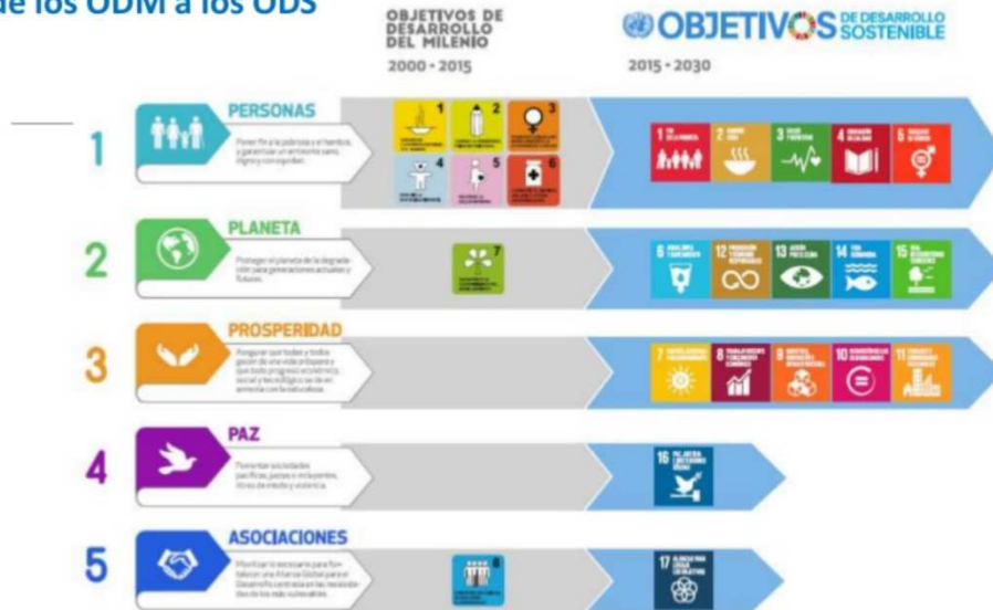
Ilustración 3. De los ODS a los ODM