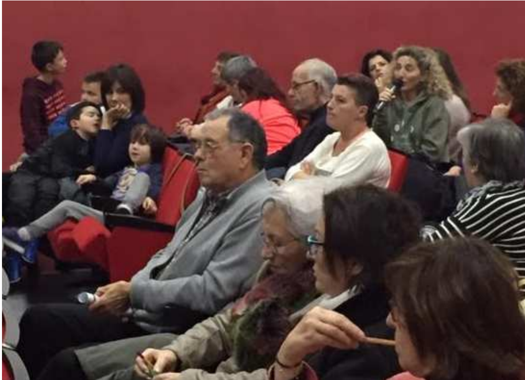
Ilustración 18. Participación y feedback por parte de vecinas tanto al proceso como a los resultados