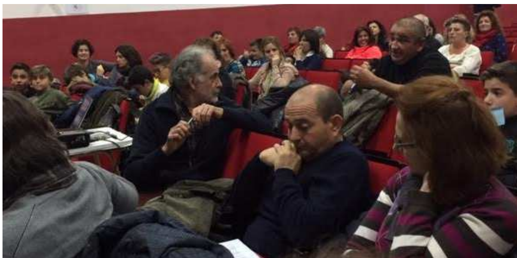
Ilustración 17. Exposición de reflexiones por parte de los participantes del Rural Lab.