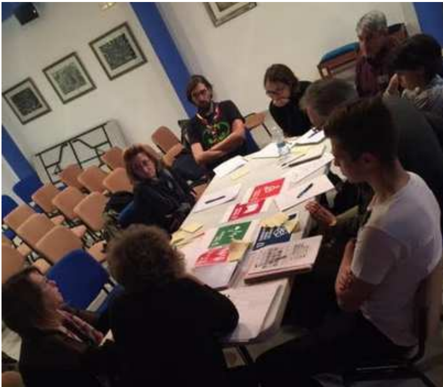
Ilustración 24. Momentos de análisis colectivo sobre las problemáticas identificadas