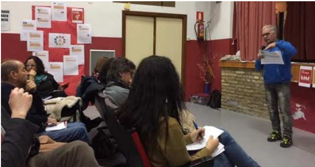
Ilustración 16. Presentación de resultados en sesión abierta

En el caso de los Laboratorios, se propuso que algunos actores locales participaran en la presentación de los resultados (problemas identificados, propuestas consensadas). Este ejercicio fue importante de cara a visibilizar a los participantes para ejercer su voz y su reflexión frente a sus vecinos. La presentación de los resultados fue previamente discutida entre los participantes. Luego de la presentación se abrió un debate entre los participantes y se entregaron papeles autoadheribles para escribir ideas que consideraran necesarias para complementar los resultados obtenidos. Estas papeletas se pegaron en un mural donde se exhibía una síntesis visual de la exposición. Este ejercicio participativo se complementó con las intervenciones de las autoridades correspondientes.