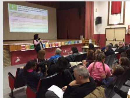
Rural Lab en Ejea: Bardenas, El Bayo, El Sabinar, Pinsoro, Rivas, Santa Anastasia y Valareña.