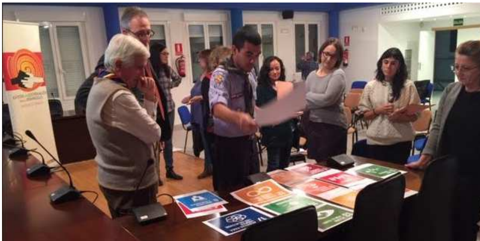
Ilustración 22. Consenso de la selección de ODS priorizados para futuras actuaciones

La sesión culminó poniendo en común aquellos seleccionados por los diferentes grupos argumentando aquellos en los que se difería y consensando entre todos una selección colectiva de aquellos ODS en los que profundizaríamos en la siguiente sesión. Se propone trabajar en grupos para profundizar los ODS que se propongan.