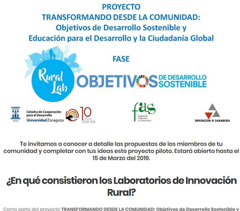
Ilustración 27. Contenido de la página https://interhes.org/laboratorios-rurales/

El presente informe integra los diferentes resultados de los laboratorios de innovación social. Se han sistematizado las contribuciones que se hicieron en la sesión abierta así como implementado el diseño de una interfase online donde se han añadido más propuestas y comentarios para ambos laboratorios. Dicha interfase ha estado abierta durante febrero y marzo 2019 en el siguiente enlace https://interhes.org/laboratorios-rurales/ teniendo el siguiente aspecto