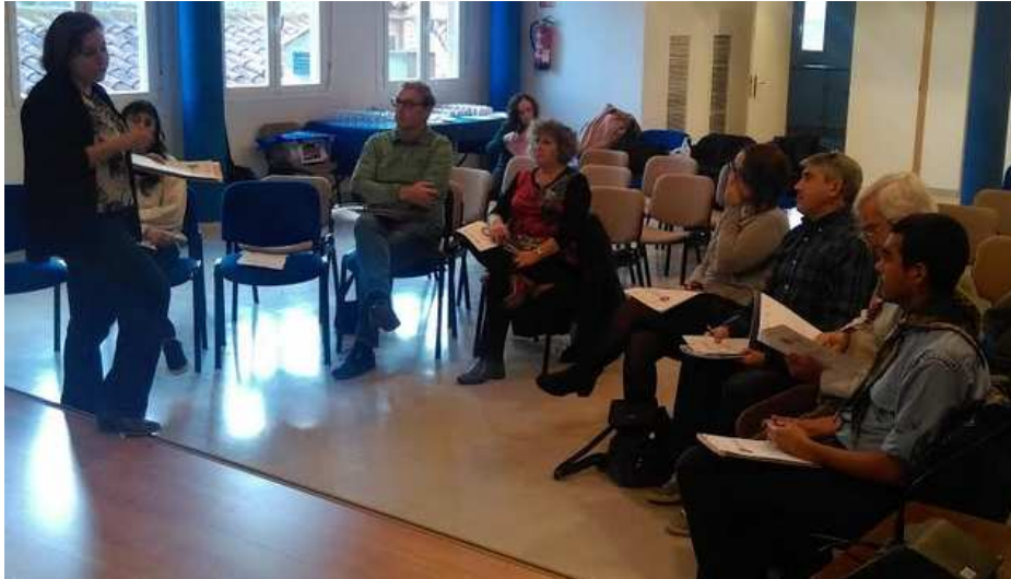
Ilustración 21. Exposición inicial sobre las características de un Rural Lab.