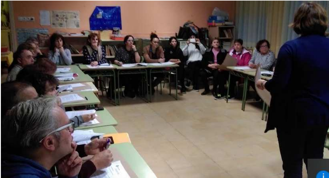
Ilustración 9. Presentación de del proyecto y los participantes del Rural Lab en Cinco Villas

El Laboratorio de Innovación Rural se realizó en Pinsoro el martes 20 de Noviembre de 2018 en la Biblioteca del C.R.A Luis Buñuel. Iniciamos con el registro y la presentación de los participantes. El equipo organizador presentó las ideas centrales y metodología de los laboratorios de innovación rural y por qué los ODS son relevantes para las comunidades rurales y metropolitanas (como es el caso de La Puebla de Alfindén). Después de la exposición, nos organizamos por grupos para debatir sobre los ODS y seleccionar aquellos más pertinentes en el contexto local. ¿Qué iniciativas existen que ya inciden en lo que proponen los ODS? ¿Qué ODS son más relevantes para nuestras comunidades inmediatas? ¿Cuáles son aquellos donde debemos de tener más incidencia para beneficio de nuestra comunidad? Las siguientes imágenes muestran la dinámicas que se realizaron en esta primera sesión: exposiciones y discusión en grupos.