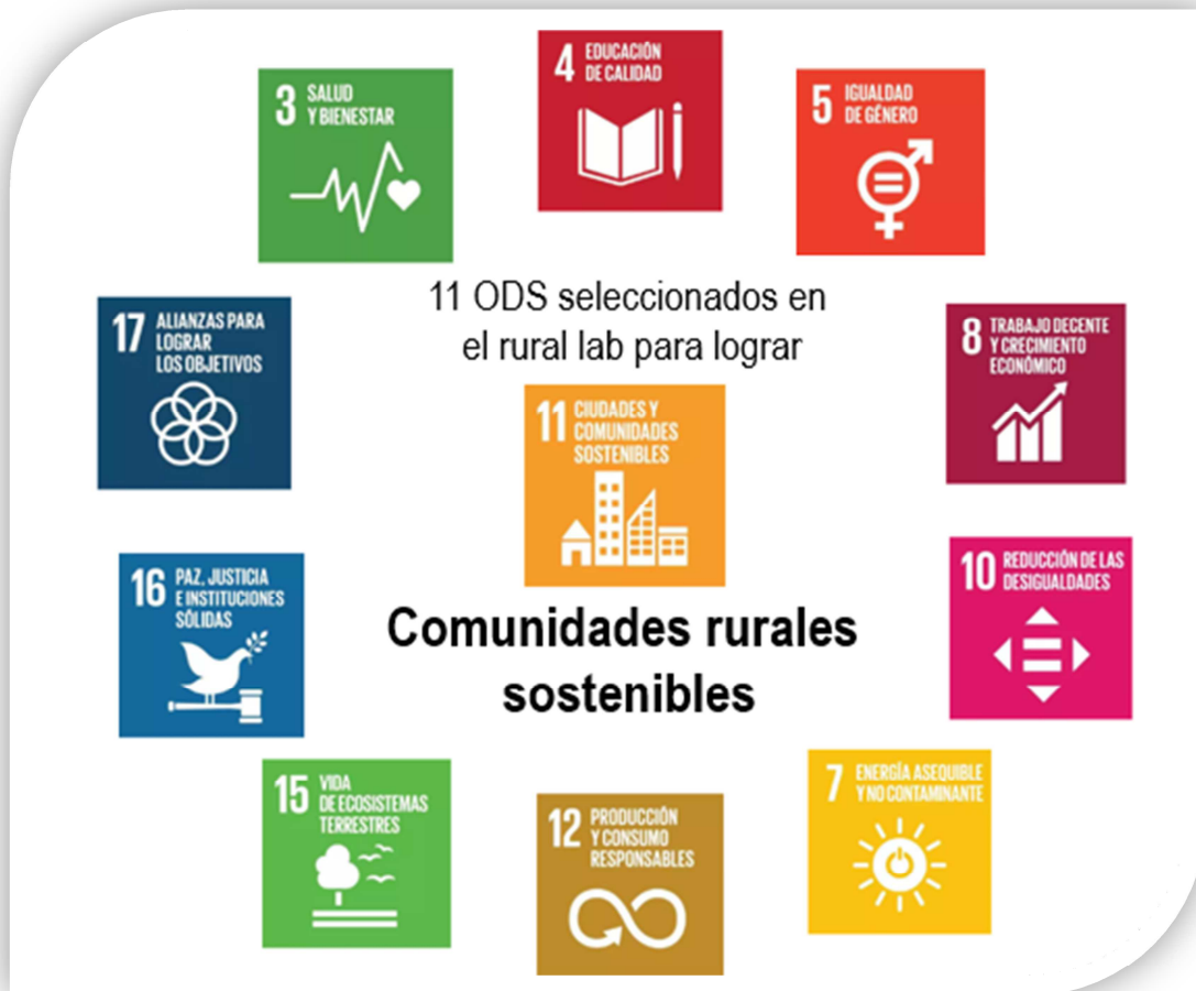
Ilustración 13. ODS seleccionados por representar retos a nivel local en los pueblos de Ejea