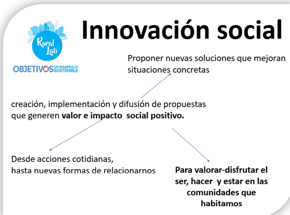
Ilustración 5. Elementos de innovación social

La metodología de investigación-acción participativa facilita la sistematización del proceso (identificar, organizar, poner en perspectiva los procesos, reflexionar) donde los actores sociales participan en la generación de conocimiento. Esto al combinarse con la lógica de los laboratorios de innovación, promueve la co-creación de soluciones o propuestas a problemas específicos que puedan convertirse en cambios o innovaciones de proceso o productos que mejoren aspectos concretos.