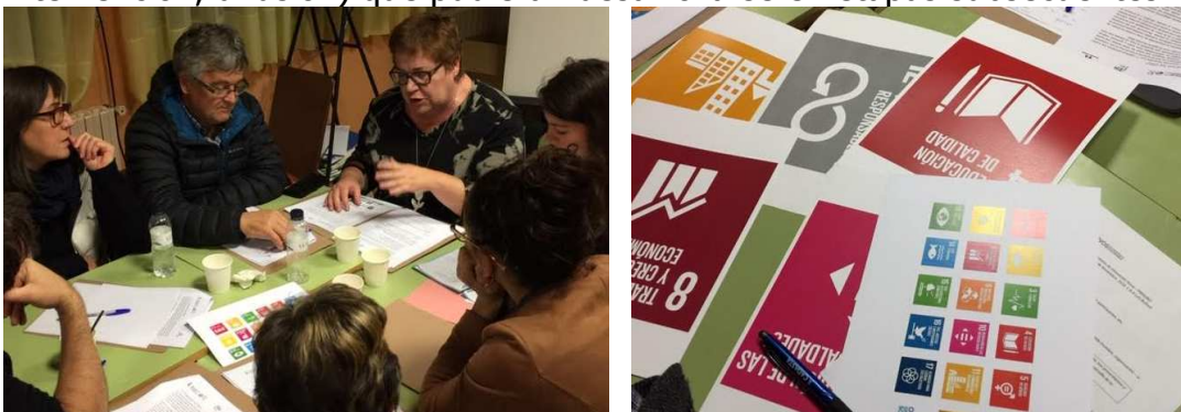
Ilustración 14. Revisión de ODS seleccionados

En este taller desarrollado el 27 de noviembre y 3 de diciembre, se trabajó a partir de los ODS seleccionados en el primer taller. Los participantes identificaron a fondo problemas e hicieron propuestas (innovación, intervención, difusión) que pudieran desarrollarse en etapas subsecuentes.