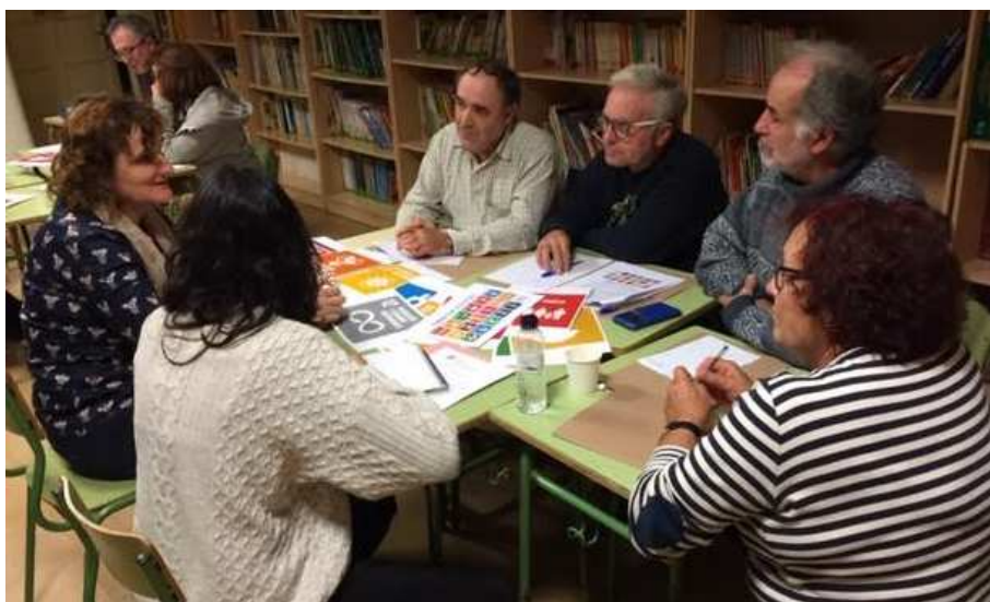
Ilustración 11. Discusión en grupos sobre las implicaciones de los ODS a nivel local