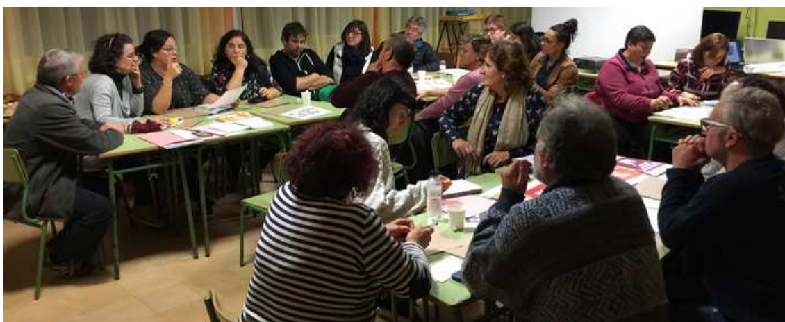
Ilustración 12. Discusión preliminar de los retos ODS a nivel local