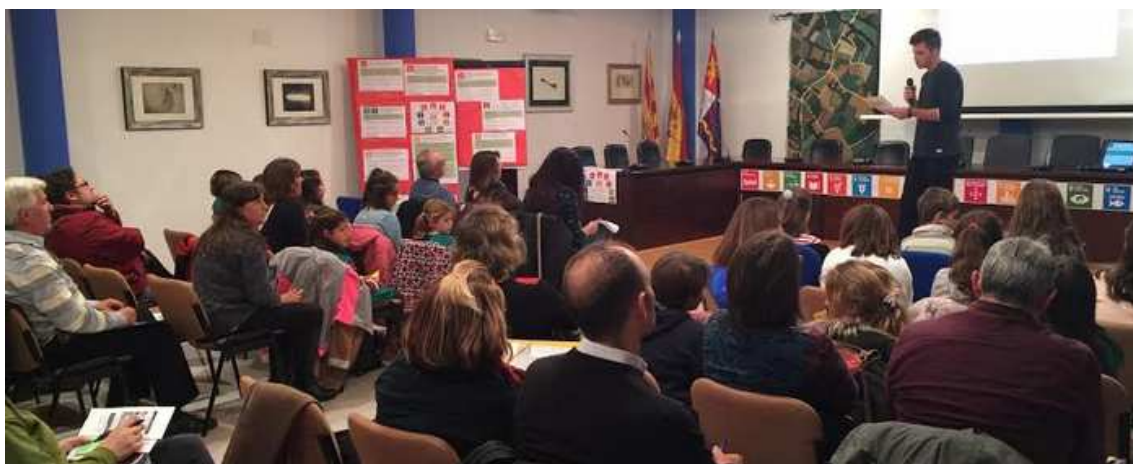
Ilustración 25. Presentación de resultados por parte de un participante local del Rural Lab