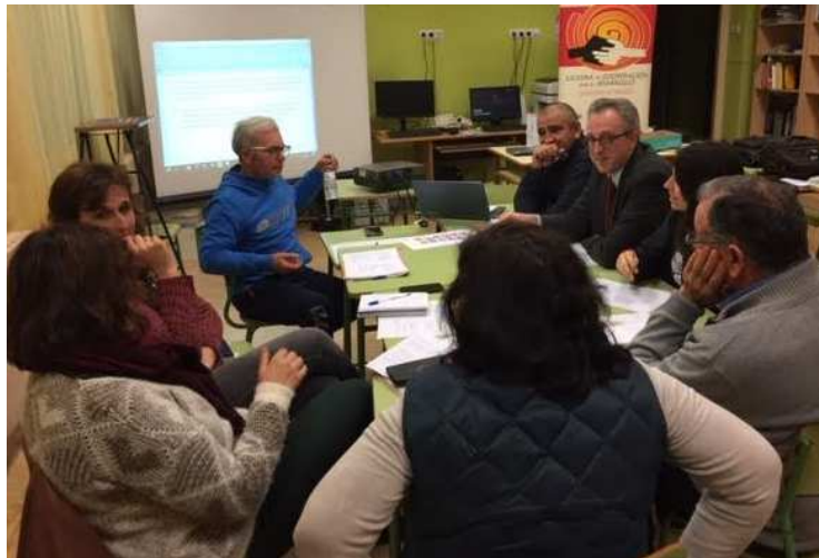
Ilustración 15. Momentos de análisis colectivo sobre las problemáticas identificadas

Entre las necesidades expresadas cabe destacar la problemática de la despoblación de la zona, con lo que ello conlleva como cierre de pequeños comercios o unas tasas muy bajas de infancia y juventud. Todos los asistentes estaban de acuerdo en la importancia de la participación y unión para buscar soluciones y crear alternativas para mejorar el futuro del mundo rural. En especial había un sentimiento de que la población joven no se implicaba y participaba en la vida y necesidades de la zona. Otro tema relacionado con la despoblación, y en el que también se hizo hincapié es el envejecimiento de la población y la necesidad de atender esta realidad. La problemática del empleo y la urgencia de su dinamización fue otro de los temas que salió a la luz. Por último también la importancia de una concienciación y sensibilización de la población en general y en especial de los niños y jóvenes y las oportunidades que supone la creación de alianzas y redes para afrontar todas estas necesidades. Se exponen a continuación los ODS que inciden en problemáticas locales y las propuestas que se generaron en esta etapa piloto de los rural Lab en Ejea de los Caballeros