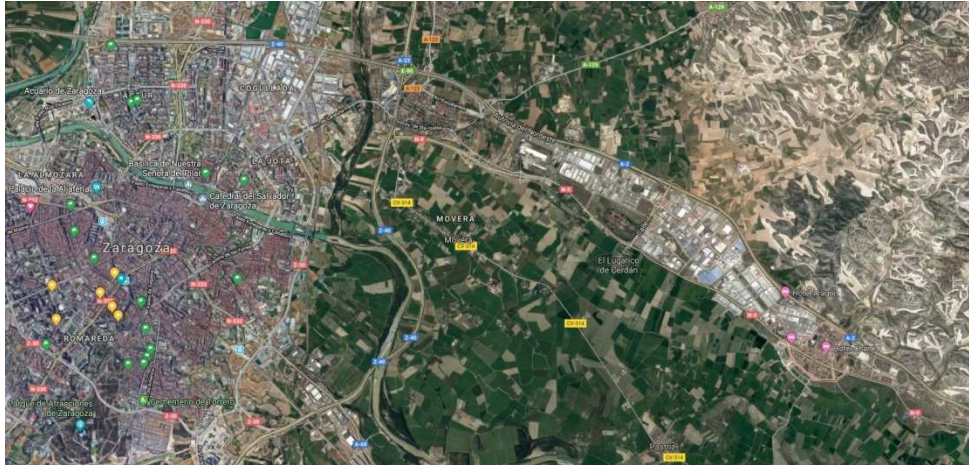
Ilustración 8. Imagen satelital (Google maps) de la zona del municipio de La Puebla de Alfindén, municipio colindante con Zaragoza.

El municipio ha tenido una tradición agraria por sus características de suelo y cultivo. Sin embargo su desarrollo industrial ha generado un aumento de la población activa industrial, en detrimento de la agraria. En los últimos 20 años, se estima que la mano de obra industrial ha pasado del 30% al 80%. En contraste, el sector primario comienza a estancarse, tanto por su productividad poco competitiva, como por la estructura de sus explotaciones. El promedio de edad de ellos supera la cincuentena, en tanto que la tendencia de las nuevas generaciones es incorporarse al sector industrial. El sector secundario es el más dinámico actualmente, ocupando la mayor parte de la población del municipio y nuevos pobladores.