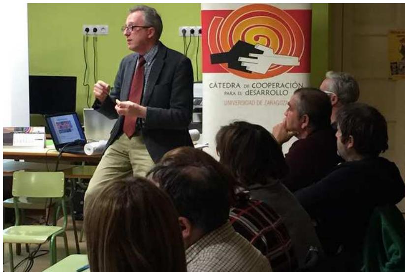
Ilustración 10. Exposición ODS En el Rural Lab de las Cinco Villas(1er sesión)